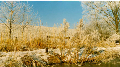
Teich 2 Winter