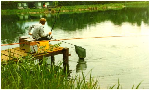
Teich 1 mit Anglerheim