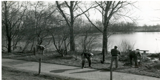
Teich 2 Arbeitsdienst