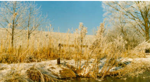
Teich 2 Winter