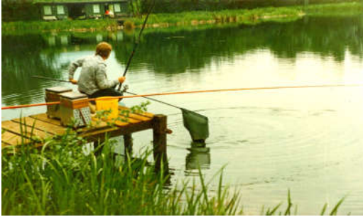
Teich 1 mit Anglerheim