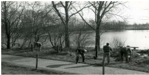
Teich 2 Arbeitsdienst